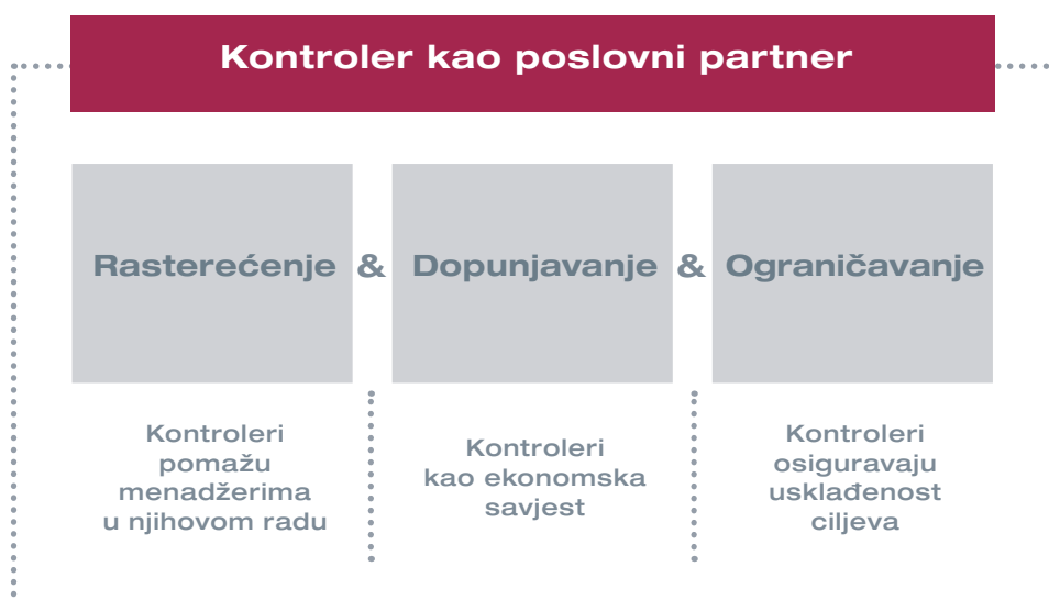
Slika 3: Potpora upravljanju od strane kontrolera prema: Weber / Schäffer

Suradnja između menadžera i kontrolera u ovoj vrsti poslovnog partnerstva trebala bi biti zasnovana na ravnopravnoj osnovi. Doduše, menadžeri su odgovorni za određivanje smjera za postizanje ciljeva poduzeća, ali isto tako u današnje vrijeme kontroleri za to imaju također suođgovornost. Stoga kontroleri ne bi trebali pasivno čekati na upute menadžera, nego djelovati kao proaktivni i komplementarni partner menadžmenta. To se odnosi kako na rutinske poslovne aktivnosti, tako i na nove temeljne razvojne inicijative, npr. uspostavljanje orijentacije prema dodanoj vrijednosti ili održivosti u korporativnom upravljanju. Središnji aspekt uloge poslovnog partnera je prepoznati i unaprijediti takve teme. Pri tome je iznimno važno da kontroleri postignu ravnotežu između aktivnog sudjelovanja u procesu upravljanja u koji unose vlastite ideje s jedne strane, dok je s druge strane njihova restriktivna funkcija čuvara interesa poduzeća i kritički nastrojen partner ili sparing-partner ("uključenost nasuprot neovisnosti"). Kontroleri moraju biti u stanju "nositi dvije kape".