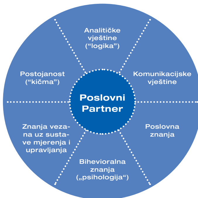
Slika 4: Ključne kompetencije kontrolera

Ako kontroleri žele pružiti sveobuhvatnu potporu menadžerima, trebaju imati široki raspon vještina koje se mogu svesti na šest ključnih kompetencija. Ovo je klasična shema zahtijevanih kompetencija prema Albrechtu Deyhleu koja svakim danom postaje sve važnija za kontrolera kao poslovnog partnera: