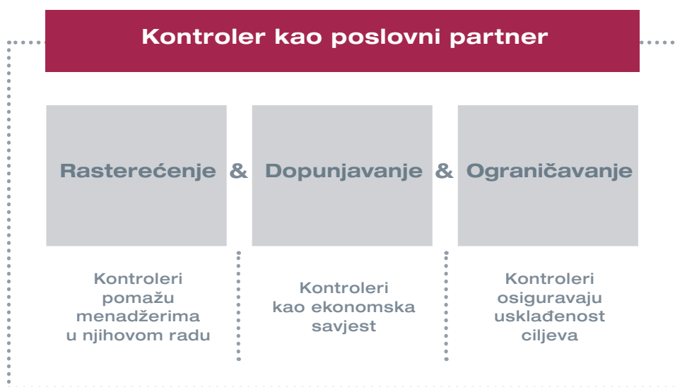
Slika 3: Potpora upravljanju od strane kontrolera prema: Weber / Schäffer

Suradnja između menadžera i kontrolera u ovoj vrsti poslovnog partnerstva trebala bi biti zasnovana na ravnopravnoj osnovi. Doduše, menadžeri su odgovorni za određivanje smjera za postizanje ciljeva poduzeća, ali isto tako u današnje vrijeme kontroleri za to imaju također suodgovornost. Stoga kontroleri ne bi trebali pasivno čekati na upute menadžera, nego djelovati kao proaktivni i komplementarni partner menadžmenta. To se odnosi kako na rutinske poslovne aktivnosti, tako i na nove temeljne razvojne inicijative, npr. uspostavljanje orijentacije prema dodanoj vrijednosti ili održivosti u korporativnom upravljanju. Središnji aspekt uloge poslovnog partnera je prepoznati i unaprijediti takve teme. Pri tome je iznimno važno da kontroleri postignu ravnotežu između aktivnog sudjelovanja u procesu upravljanja u koji unose vlastite ideje s jedne strane, dok je s druge strane njihova restriktivna funkcija čuvara interesa poduzeća i kritički nastrojen partner ili sparing-partner ("uključenost nasuprot neovisnosti"). Kontroleri moraju biti u stanju "nositi dvije kape".